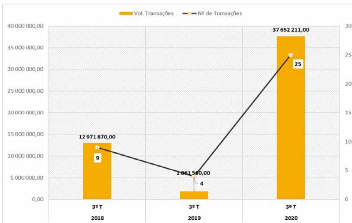
Gráfico 2 Volume global de transações em MS

No 3T de 2020, ao contrário do 3T de 2019, o segmento de Mercado de bolsa foi o segmento com maior volume de transações. Não se registaram transações em mercado fora de bolsa – para títulos cotados (listed), como ocorreu no 3º trimestre de 2019.